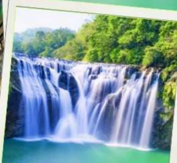
น้ำตกซือเฟิ่น