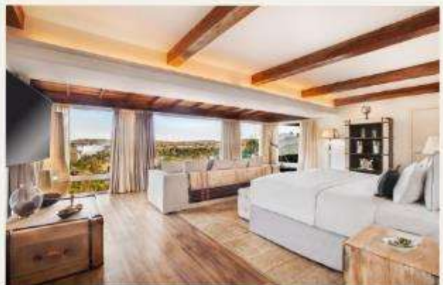
Hotel das Cataratas, A Belmond Hotel