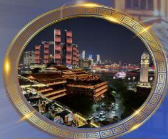
มือคำร้านอาหารวิวหลักลัน