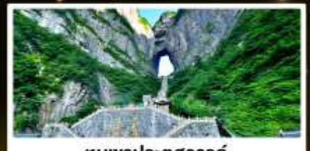
ทิวเขาประตูสวรรค์