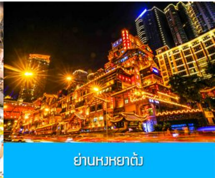
ย่านหงหยาดง