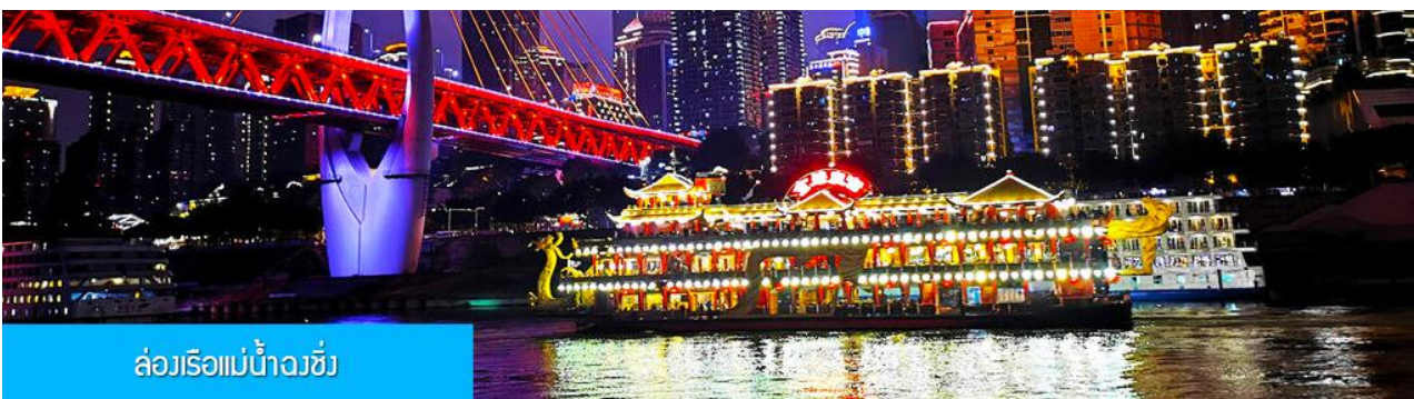
ล่องเรือแม่น้ำฉวี่