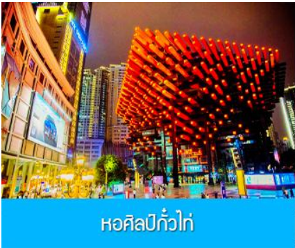
หอศิลป์กั๋วไถ่

นำท่านเก็บภาพที่แสนมหัศจรรย์ ณ สถานีรถไฟลอยฟ้า หลี่จื่อป้า 穿楼轻轨 ชมและเก็บภาพความมหัศจรรย์ของ ขบวนรถไฟที่วิ่งทะลุตัวตึก และจอดเทียบสถานีที่ตั้งอยู่บริเวณชั้นที่ 6-8 ของอาคาร และขบวนรถไฟจะไปทะลุออกอีกด้านหนึ่งของตัวอาคาร พร้อมก็นำท่านนั่งรถไฟทะเลตุ๊ก