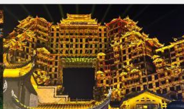
ตีทมหัตศวรรษ 72