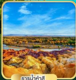
ธารน้ำห้าสี