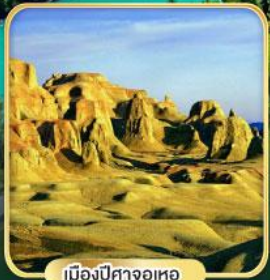
เมืองปีศาจอุเทอ