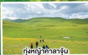
ทุ่งหญ้าคาลาจูน