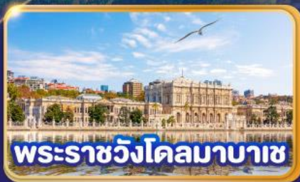
พระราชวังโคลมาบาซ