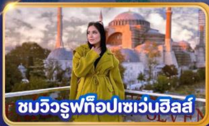
ชมวิวยุฟทือปเซเวนฮิลส์