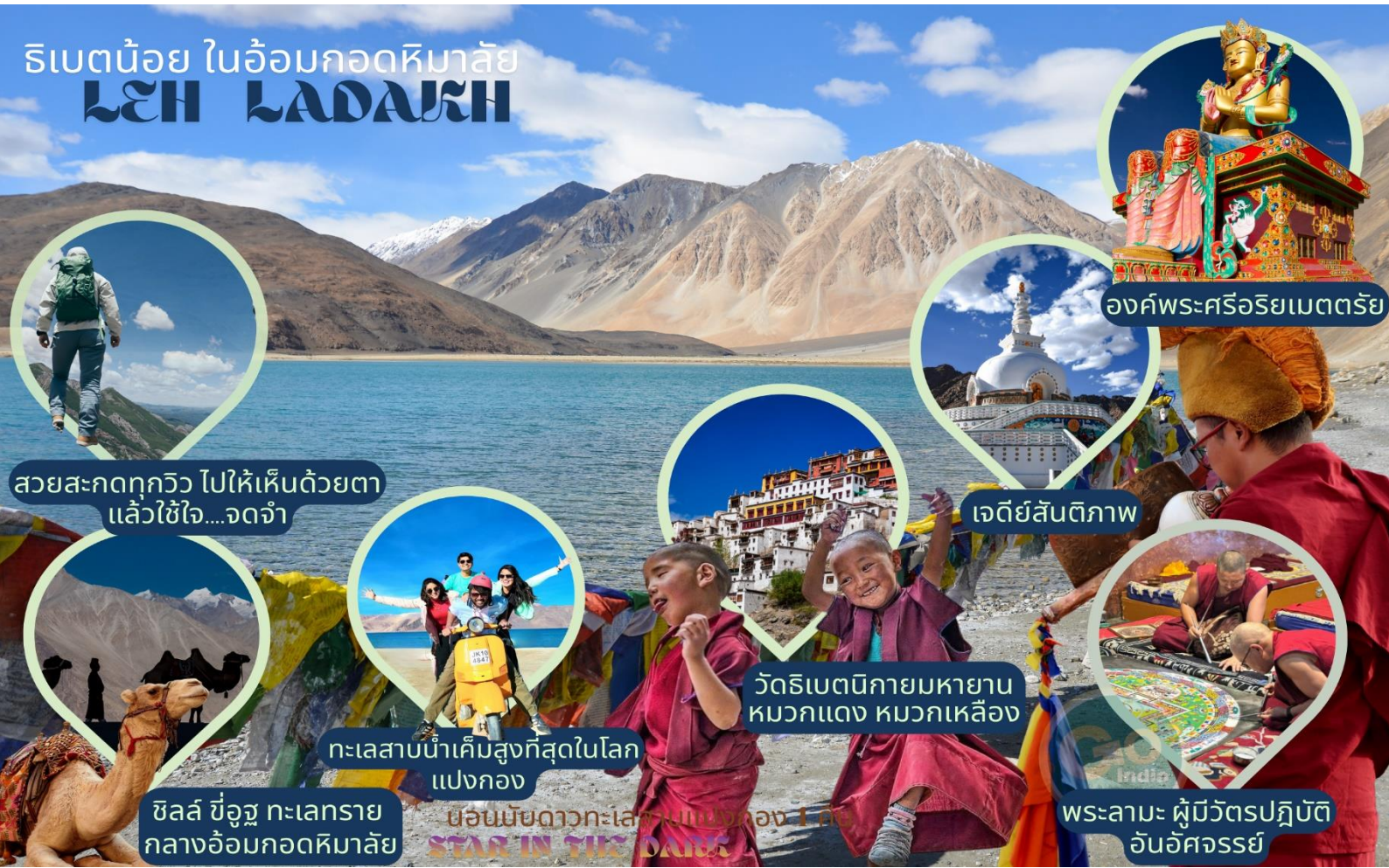
องค์พระศรีอริยเมตตรีย์