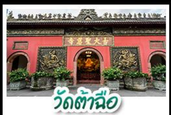
วัดต้าอื่อ