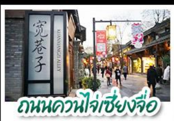
ถนนควนโจ้วเซียงจื่อ