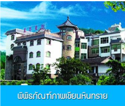
พิพิธภัณฑภาพเขียนหินทราย