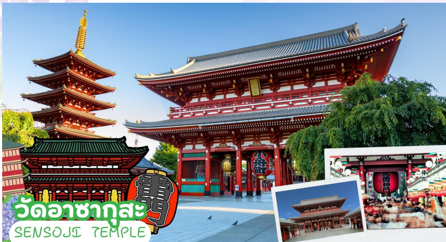
วัดอาซากุสะ SENSOJI TEMPLE

“คามินาริมง (ประตูฟ้าคำราม)” ซึ่งมีโคมไฟสีแดงที่ได้ชื่อว่าเป็น “โคมไฟที่ใหญ่ที่สุดในโลก” มีความสูงใหญ่ถึง 4.5 เมตร อีกทั้งยังมี “ถนนนากามิเสะ” ถนนร้านค้าแหล่งรวมสินค้าของที่ระลึกต่างๆ มากมาย อาทิ พวงกุญแจ ตุ๊กตาแมววัก ดาบซามูไร ชุดกิโมโน ร่มญี่ปุ่น หรือ ขนมอาเกมันจู ขนมขึ้นชื่อของวัดอาซากุสะ