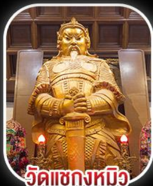
วัดเขกงหนิว

สวนสนุก CHIMELONG SPACESHIP PARK เจ้าแม่กวนอิมรพีลิสเบย์ - เจ้าแม่กวนอิมฮ่องกง วัดเขกงหนิว - พระใหญ่ของปิง+กระเช้า เมนูสุดพิเศษ!! เป้าอ้อ+ไวน์แดง , ห่านย่าง