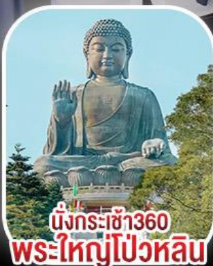
นั่งกระเช้า360 พระใหญ่ปิงหวิน