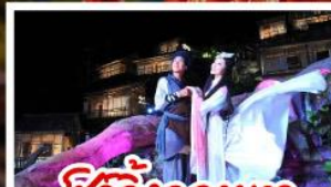
โชว์จิ้งจอกขาว