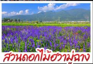
สวนดอกไม้ฮัวมู่ฉาง