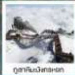
อุทยานวิวัฒนาการ