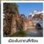
เมืองโบราณตงชวง