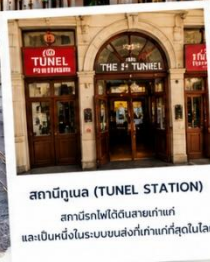
สถานีทูนเนล (TUNEL STATION) สถานีรถไฟใต้ดินสายเก่าแก่ และเป็นหนึ่งในระบบขนส่งที่เก่าแก่ที่สุดในโลก

🚊 ไอโกลด์ที่ห้ามพลาด! รถรางสีแดงสัญลักษณ์ ของย่านทักซิม