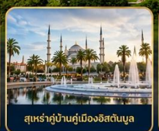
สุเหร่าบ้านคูเมืองอิสตันบูล