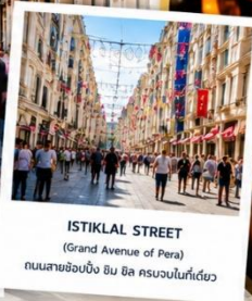
ISTIKLAL STREET (Grand Avenue of Pera) ถนนสายช้อปปิ้ง อิม บิล ครอบคลุมในทีเดียว