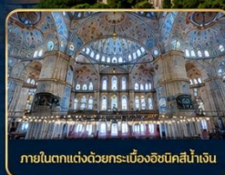
ภายในตกแต่งด้วยกระเบื้องอิสตันบูลสีน้ำเงิน