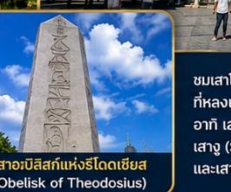
เสาอเบลิสก์แห่งโรโดเดียม (Obelisk of Theodosius)