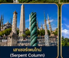
เสาฮอร์เพนไทน์ (Serpent Column)