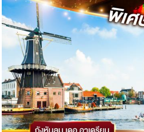
กังหันลม เดอ อาเดรียน