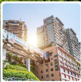
รถไฟทะลุถ้ำ