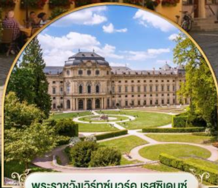
พระราชวังแวร์ซายส์ ฝรั่งเศส