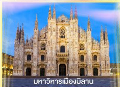
มหาวิหารเมืองมิลาน