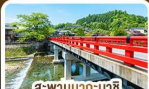
สะพานนากะบาชิ ทาคายาม่า