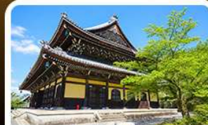
วัดนันเซ็นจิ