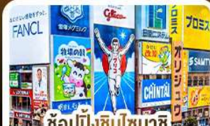
ช้อปปิ้งชินไซบาชิ และโดตงโมริ