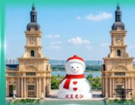
ตึกตาสีเมย์กซ์ ฮาร์บิน