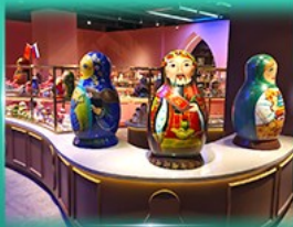
พิพิธภัณฑ์ ตุ๊กตาแม่ลูกดก