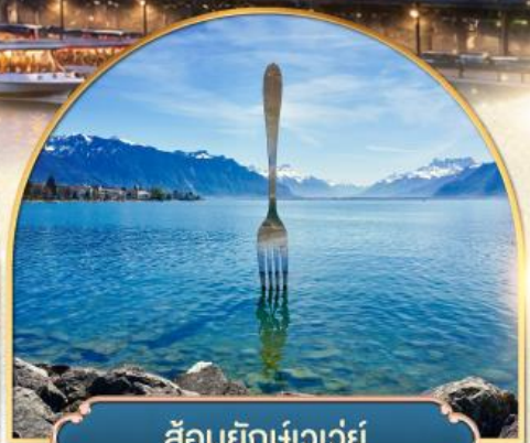
ล้อมยึกเขาวัว