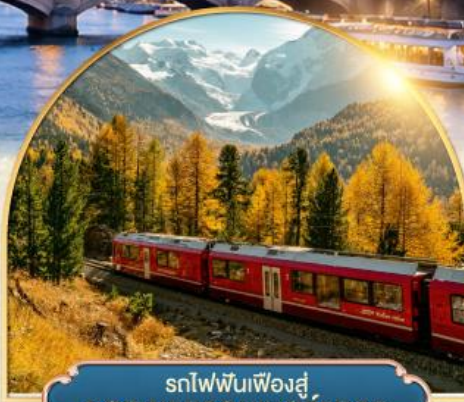
รถไฟฟันเฟืองสู่ยอดเขากรอนเนอ์เกรต