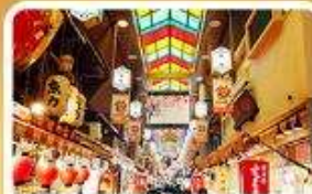
ตลาดปลาฮิชิ