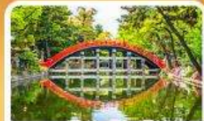
ศาลเจ้าสุมิโยชิ โทคะ