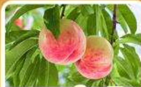
กิจกรรมเก็บผลไม้