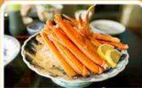
พิเศษ! ชาบู