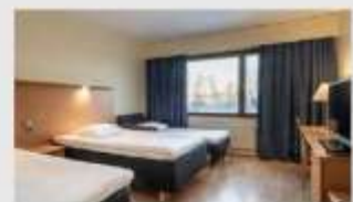
Triple สำหรับ 3 ท่าน