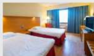
Twin สำหรับ 2 ท่าน