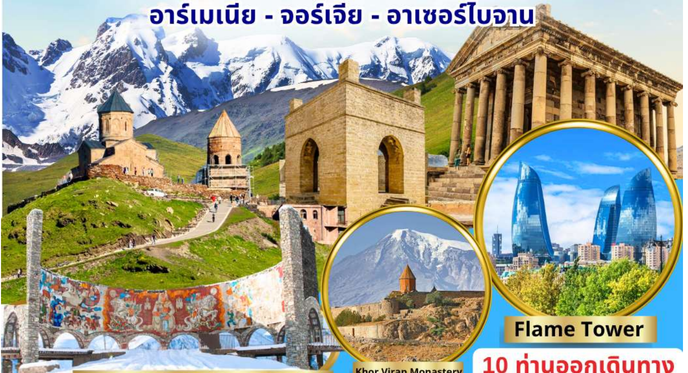
Georgian-Russian Friendship Monument