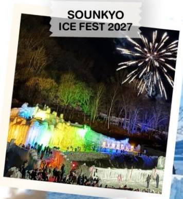
SOUNKYO ICE FEST 2027