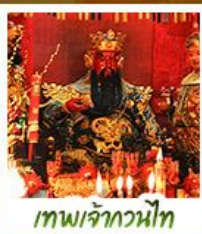
เทพเจ้ากวนไท