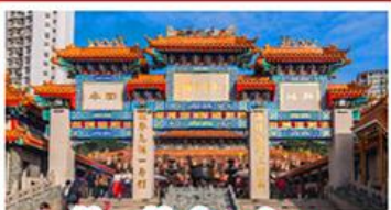
วัดเขว้งต้าเซียน