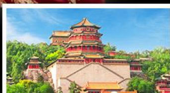
พระราชวังฤดูร้อนอ้อเหอหยวน