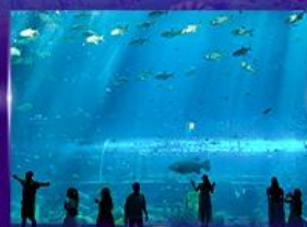
อควาเรียมยักษ์รูปเต่า