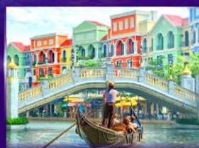
เวนิสจำลอง แกรนด์ เวิลด์