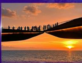
สะพานจูบ Sunset Town