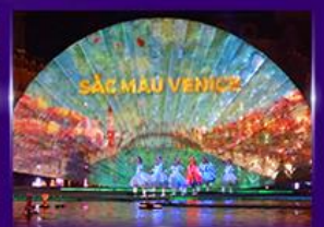
Sac Mau Venice Show