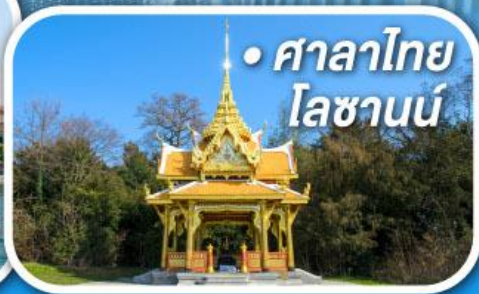
• ศาลาไทย โลซานน์

• สุดอากาศดีที่เซอร์แมท • ขึ้นกระเช้าสู่ยอดจากลาเซียร์ 3000 • ชมเมืองคลาสสิกเบิร์น ลูเซิร์น ซูริก