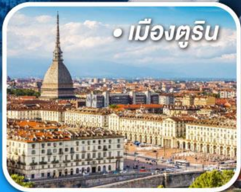
• เมืองตูริน