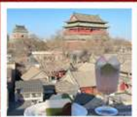
คาเฟ่ น้ำตาล