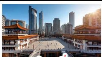
ตึกขุยซิ่ง

พระแกะสลักหินต้าจู้ - หลุมฟ้าสะพานสวรรค์ - เจานางฟ้า ตึกขุยซิ่ง - ตึกตะเกียบ - หมู่บ้านโบราณฉือซีโจว