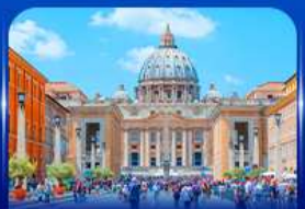
นครรัฐวาติกัน โรม