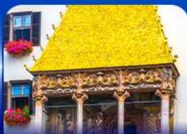
หลังคาทองคำ อินส์บรุค