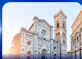
ชมเมืองแห่งศิลปะ ฟลอเรนซ์