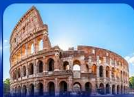
เข็ควินดัง โคลอสเซียม โรม