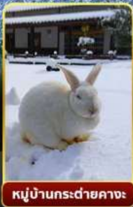
หมู่บ้านกระต่ายคางะ