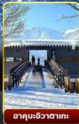
ฮาคุบะอิวาตาคะ