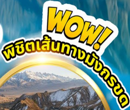
ถนนโบราณ ผานหลง