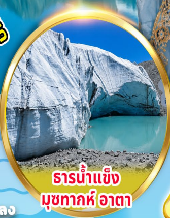
ธารน้ำแข็ง มุขทากห์อาตา