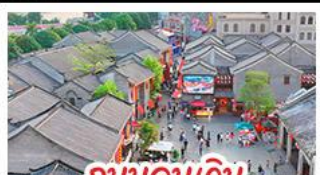
ถนนคนเดินสามนครสองฮอย