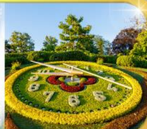
นาฬิกาดอกไม้เมืองเจนีวา